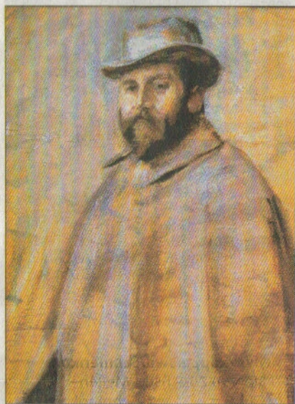
Portrait Xavier Imfeld.

«Xaver Imfeld – Meister der Alpentopographie». Historisches Museum Obwalden, Sarnen. Bis 30. November 2006. Offen: täglich 14 bis 17 Uhr. Weitere Infos: www.museum-obwalden.ch